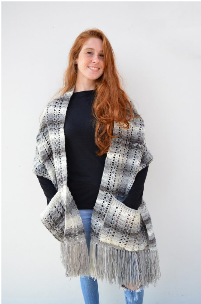
Cachecol com Bolso Grega